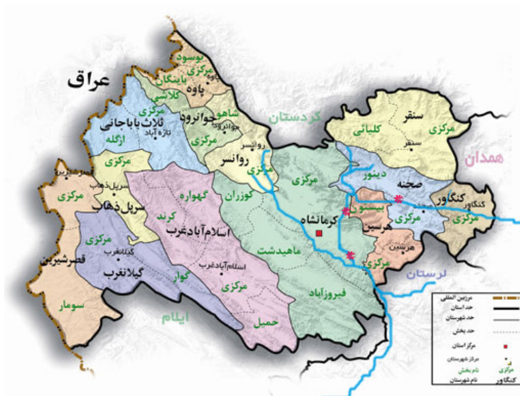
شکل ۱ مسیر رودخانه گاماسیاب در محدوده استان کرمانشاه ستاره‌های قرمز رنگ نقاط نمونه برداری را نشان می‌دهد

داده‌ها به صورت میانگین ± انحراف معیار می‌باشند.