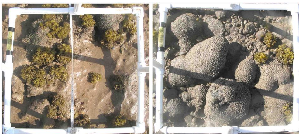
شکل ۲ کوادرات‌های عکس‌برداری شده از بستر گلی - قله‌سنگی (راست) و بستر ماسه‌ای - سنگی (چپ).