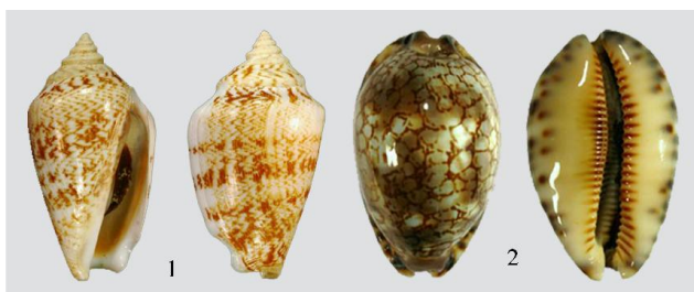
شکل ۱۱ Conomurex persicus (۱) و Mauritit grayana (۲)

(۲M)+(L۱)+R+(۱L)+(۲M) بود که شامل یک دندان مرکزی (R)، یک دندان جانبی (L)، که معمولاً به سمت دندان مرکزی خمیده شده‌اند، و دو دندان حاشیه‌ای (M) است. شکل و اندازه رادولا و دندان‌های تشکیل‌دهنده آن در دو گونه کاملاً متفاوت از یکدیگر بوده و تعداد معینی برآمدگی کوچک در لبه خود دارند.